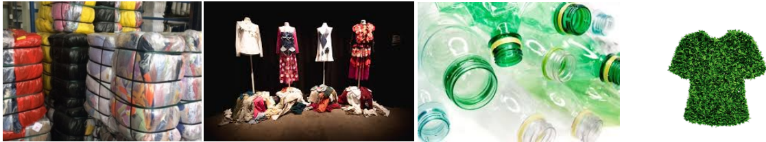
Projecten Wageningen Universiteit & Research: hergebruik textiel en circulaire materialen

Experts van Wageningen Universiteit en Material Sense geven hun visie op dit thema.